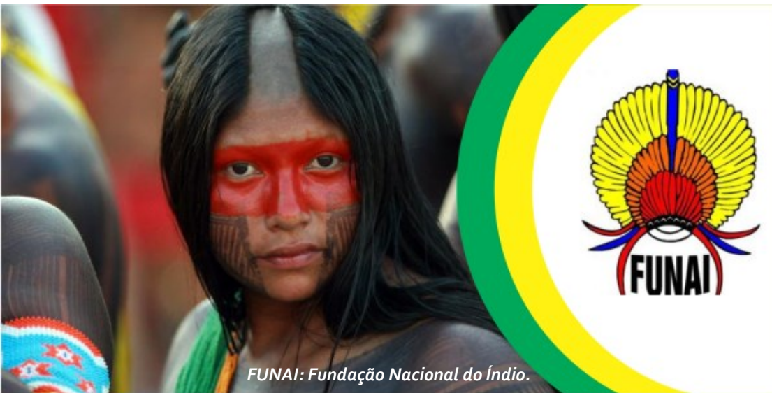
FUNAI: Fundação Nacional do Índio.

Leis já existem. Uma solução para interromper a extinção desses grupos indígenas, é trabalhar a consciência das pessoas, ampliando a fiscalização, fazendo com que as pessoas entendam que o índio é Brasil, é cultura nossa. Sobre tudo, punições severas para aqueles que desmatam indistintamente, destruindo nossa cultura, nossa história e nosso patrimônio.